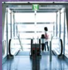
용문역사 SONGSAN SPEC 901