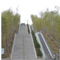
남원 춘향테마파크 옥외형 SONGSAN SPEC 901