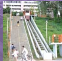
양재천 경사형엘리베이터 INCLINED ELEV.