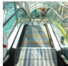
용문역사 SONGSAN SPEC 901