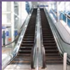
양평역사 SONGSAN SPEC 901