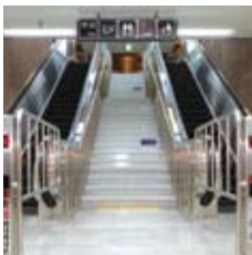
고속터미널 SONGSAN SPEC 901