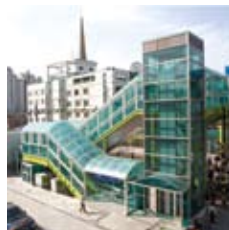
외대앞역사 SONGSAN SPEC 901